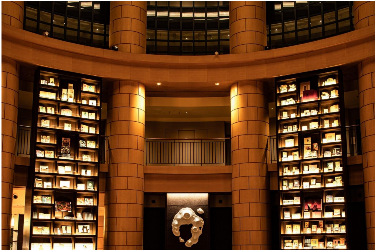
THE BASICS FUKUOKA ロビーライブラリー

『THE BASICS FUKUOKA』の最大の特徴は、約5,000冊の書物を収納したロビーライブラリーです。高さ約42メートルの吹き抜けが圧倒的なインパクトとなる円形ロビーにある12本の円柱を利用し、高さ約8メートルの書架6本を設置。書物は客室やロビーやレストランとお好みの場所で自由にお読みいただけます。