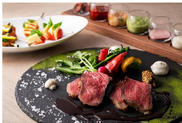
レストラン WHY NOT ディナービュッフェイメージ

朝食とディナーでは、ビュッフェに加え料理長がぜひお召し上がりいただきたいとおすすめする一品をテーブルにお届けします。