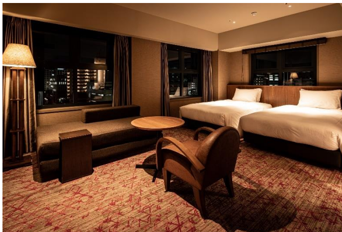
THE BASICS FUKUOKA 客室画像 03

「Chapter」は10タイプ217室。 ダブルルーム・ツインルームに加え、大人4 名様でも余裕をもってお使いいただける45 平米のお部屋もございます。ビジネスで のご利用、ご家族・グループでのご利用とも に、福岡への旅がより楽しくより良いもの となるよう細部までこだわったインテリア・備 品を設えました。