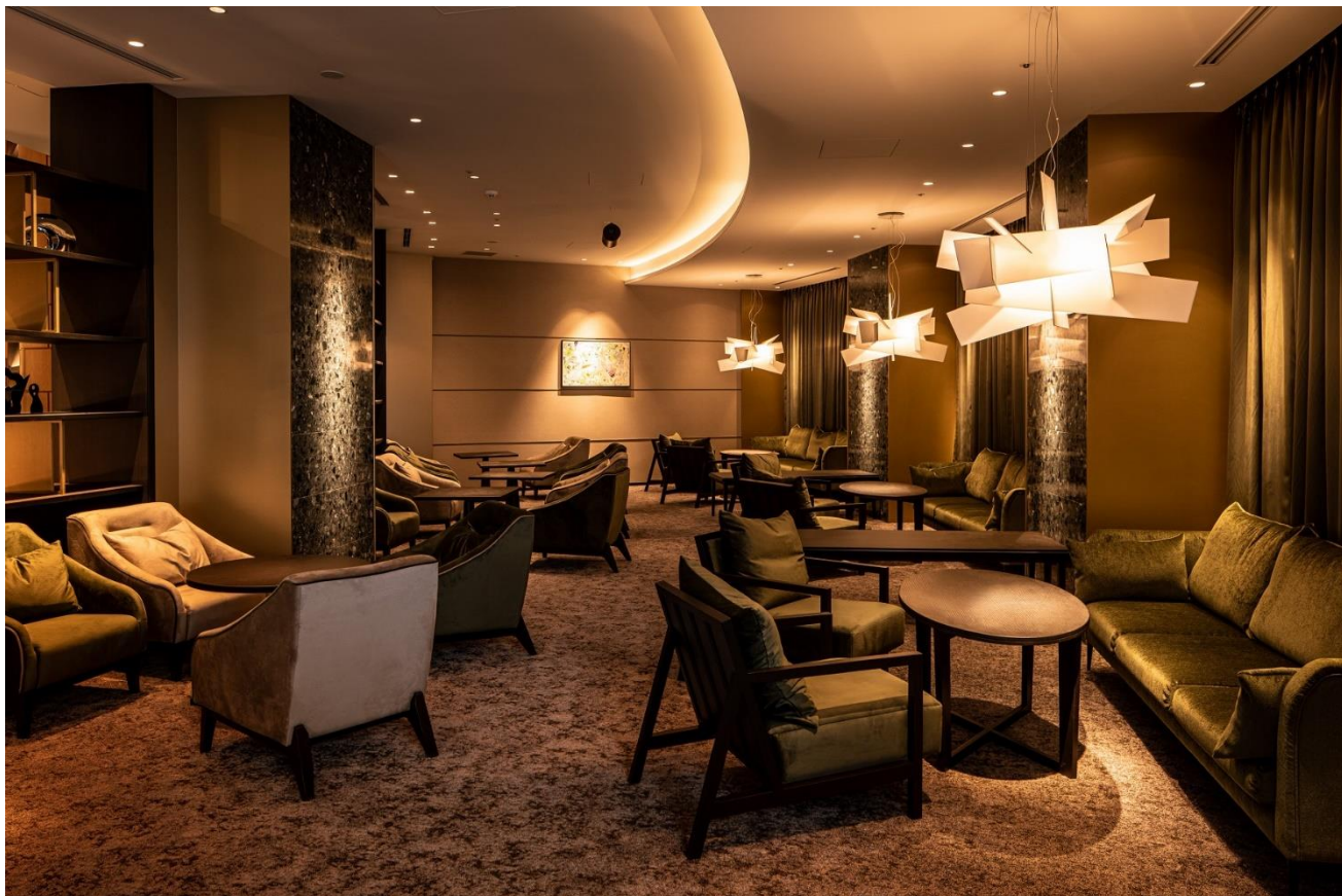
THE BASICS FUKUOKA ラウンジ

落ち着いたインテリアの中、大阪で絶大な人気を誇るタカムラコーヒーロースターズ（大阪市西区）より取り寄せた豆を使うコーヒーや、ビール・ワイン等アルコール類をフリーフローでお楽しみいただけます。