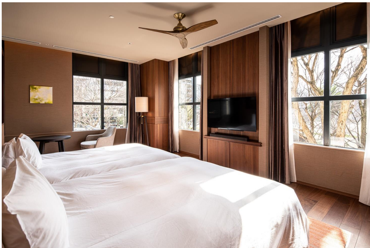
THE BASICS FUKUOKA 客室画像 02

ロビーや客室・ラウンジ・レストラン等の館内デザインに館内を飾るアートのディレクション等はグランド ハイアット 福岡レストラン THE MARKET Fやグランドプリンスホテル 高輪、羽田空港JAL国際線のサクララウンジ等を手がけたA.N.D（東京都港区）クリエイティブ・ディレクター小坂竜氏に委託、ポストモダニズムの巨匠マイケル・グレイヴス氏による旧ホテルの特徴のあるデザインを活かしつつも、これまでのイメージを一新する空間となりました。