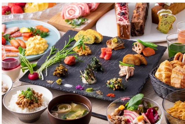
レストラン WHY NOT 朝食ビュッフェ イメージ