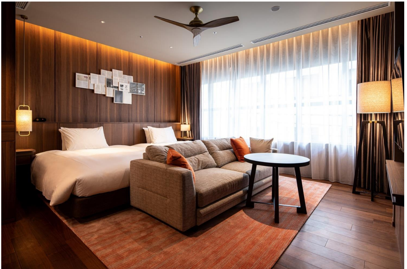
THE BASICS FUKUOKA 客室画像 01