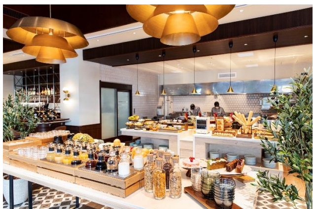
レストラン WHY NOT 朝食ビュッフェ

上質なお料理をカジュアルにお楽しみいただけるビュッフェスタイルのオールデイダイニングです