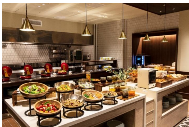
レストラン WHY NOT ディナービュッフェ