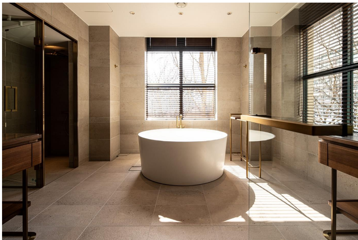
THE BASICS FUKUOKA 特別な時を演出する特別なバスルーム

さらに、『THE BASICS FUKUOKA』には特別なお部屋がございます。 このお部屋には、例えば「THE BASICS FUKUOKAに10回以上チェックインされたお客様」等、『THE BASICS FUKUOKA』がお届けする、どこにもない『THE BASICS FUKUOKA』ならではの驚きと感動に満ちた特別なお部屋にふさわしい方のみをご案内する予定です。